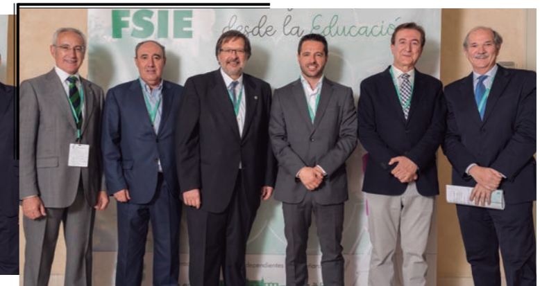
Representantes de ANPE.