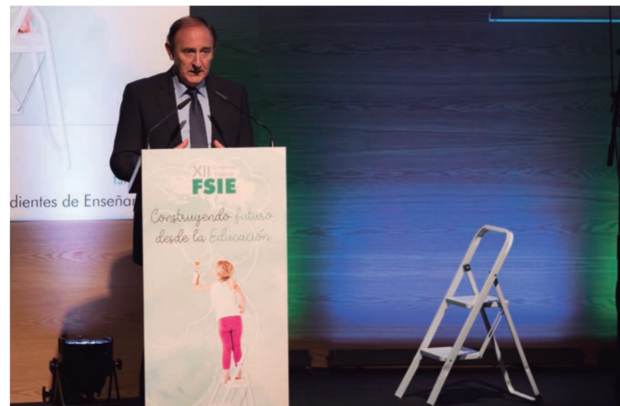
Ángel de Miguel, presidente del Consejo Escolar del Estado.

En lo que se refiere al futuro, Felpeto habló de trabajar en una nueva red de la que formen parte todos los centros financiados con fondos públicos, en la que hay que tener en cuenta la realidad social, una realidad que nos habla de menos alumnos, y menos demanda de aulas. Sin embargo, el diálogo debe ser la herramienta que posibilite el encuentro, por eso hay que intentar buscar puntos de entendimiento y no enfrentamientos.