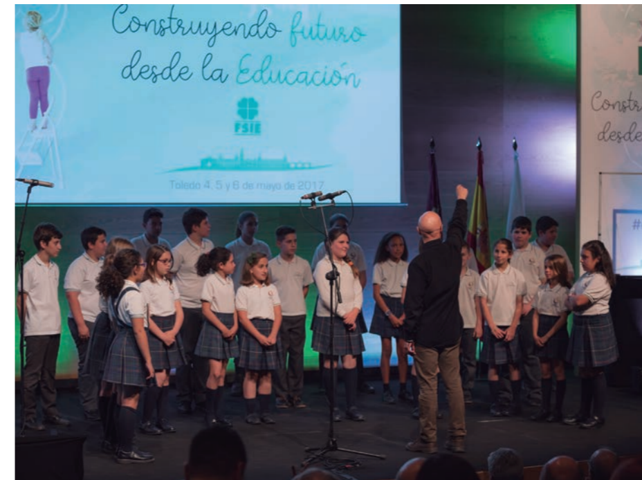
Coro de Voces Blancas del Colegio Virgen de la Caridad de Illescas (Toledo).

Puedes ver el vídeo de nuestra presentación de "Sand Art" en nuestro canal de Youtube (fsietv) o escaneando este código QR.