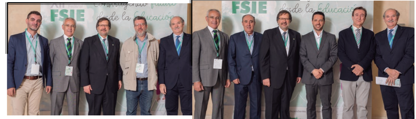
Representantes de FE-CCOO.