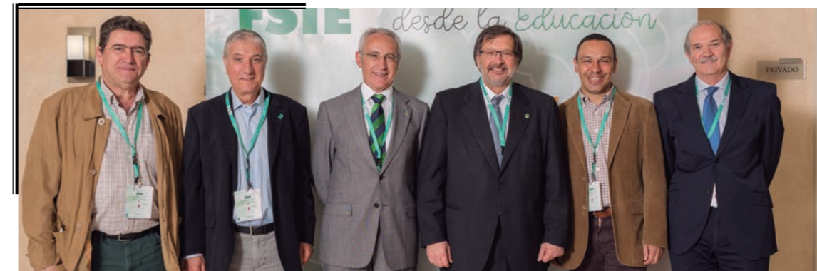
Representantes de FeSP-UGT.