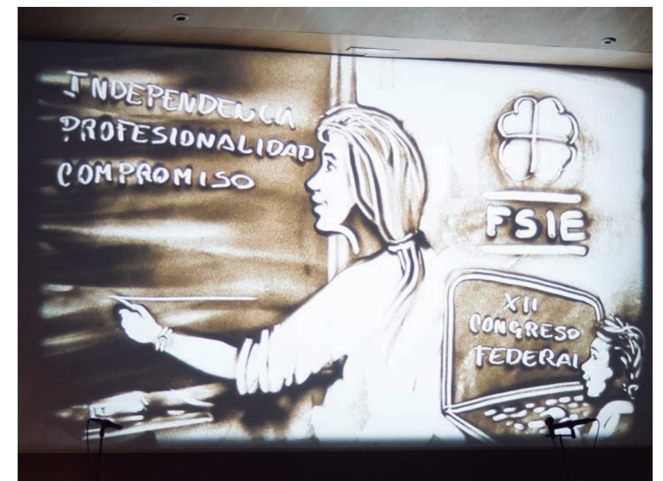
Imagen de la presentación de "Sand Art" de Felipe Mejías en el acto inaugural del XII Congreso Federal de FSIE