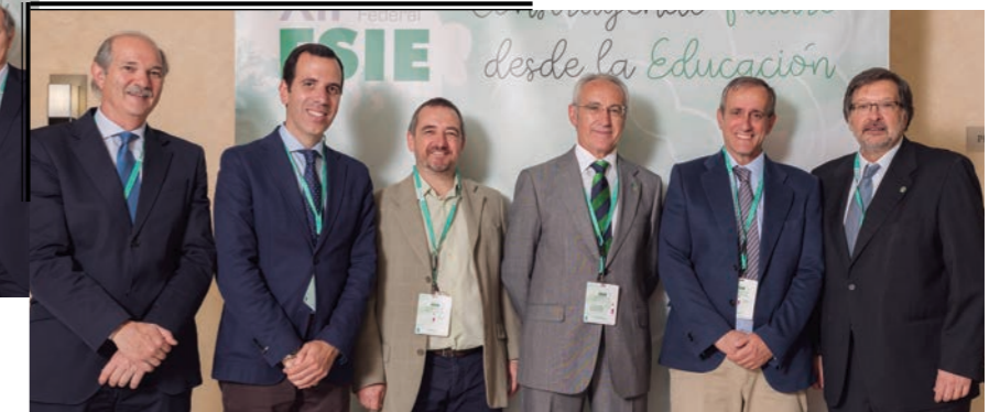
Representantes de FEUSO.