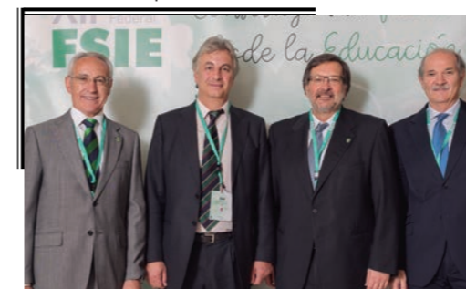
Ángel Menéndez, presidente de FORO SI.